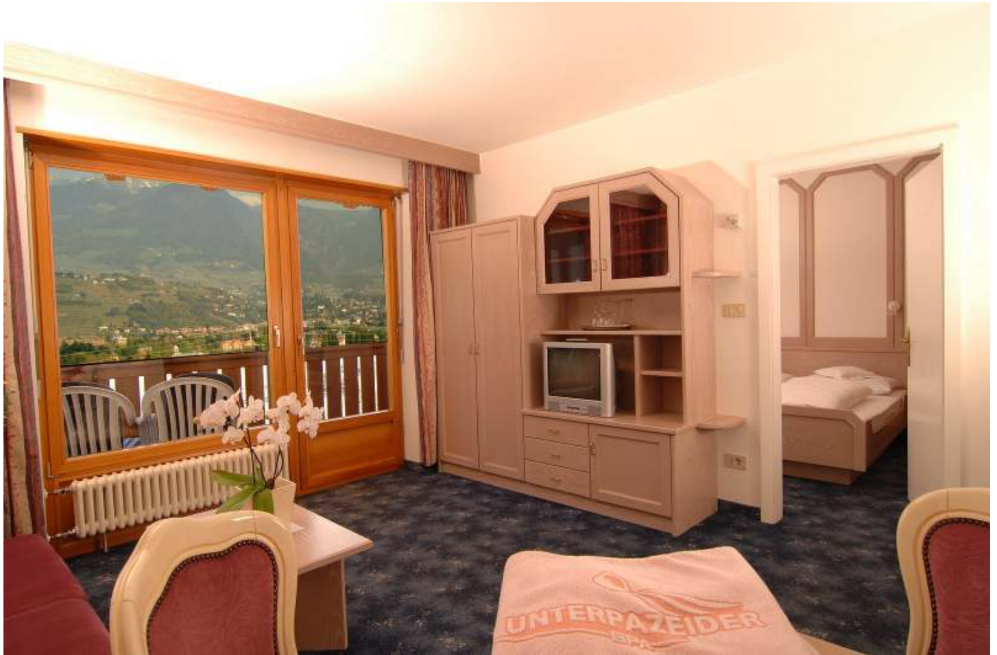
Residence * * * * SUITE mit Wohnzimmer, Schlafzimmer und Blick nach Meran. 2-4 Personen