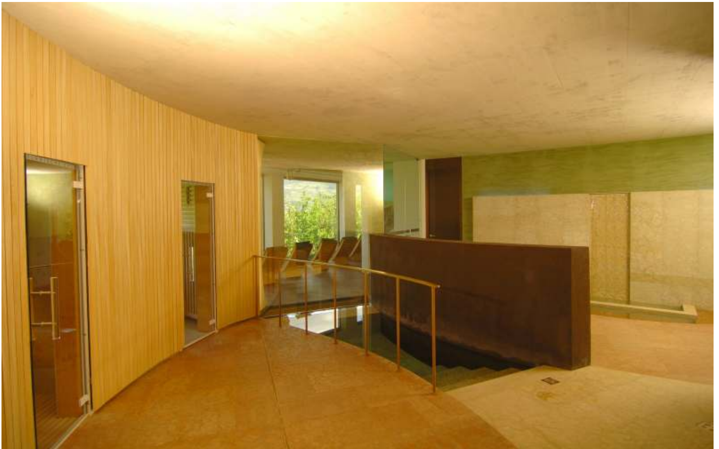
Nacktbereich mit Tauchbecken, heller Finnischer Sauna, heller Biosauna, beide mit großem Fenster mit Sicht nach Meran, dahinter Kneipp-Kalt-Warmwasser-Wechselbad und Panorama-Ruheraum mit Blick nach Meran.