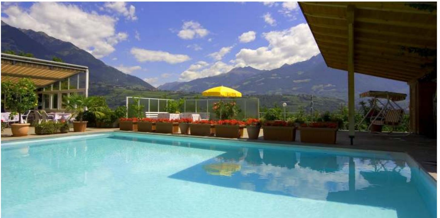
Freibad (5x10m, 25°Celsius) mit Blick nach Meran, Besonderheit: Wasser ist salzangereichert und sehr chlorarm