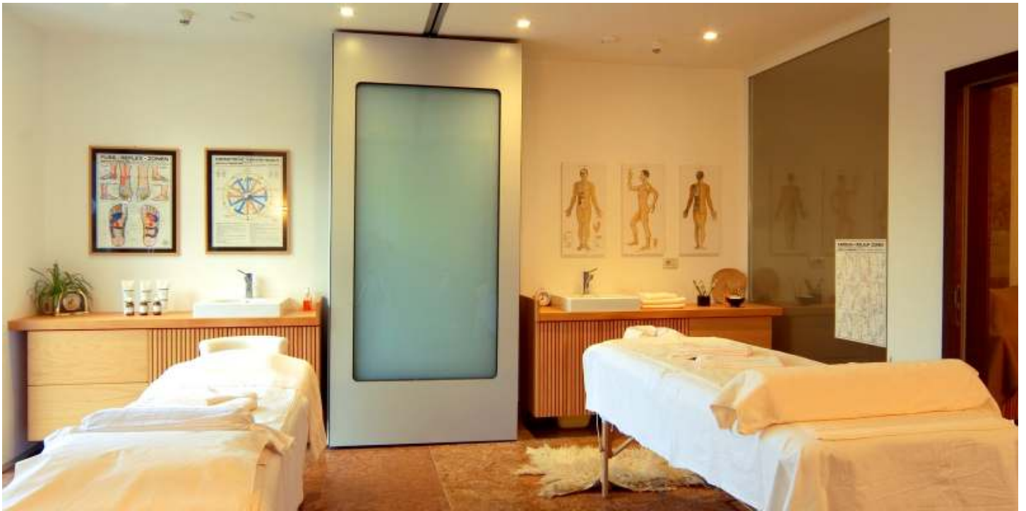
Zwei der 4 Massageräume, Heubad und Ayurveda sowie Rolfing, Shiatsu, Lomi Lomi Nui u.v.m. Wir bieten unseren Gästen hochwertige Kosmetikprodukte u. Anwendungen aus der G. Gruber Linie an.