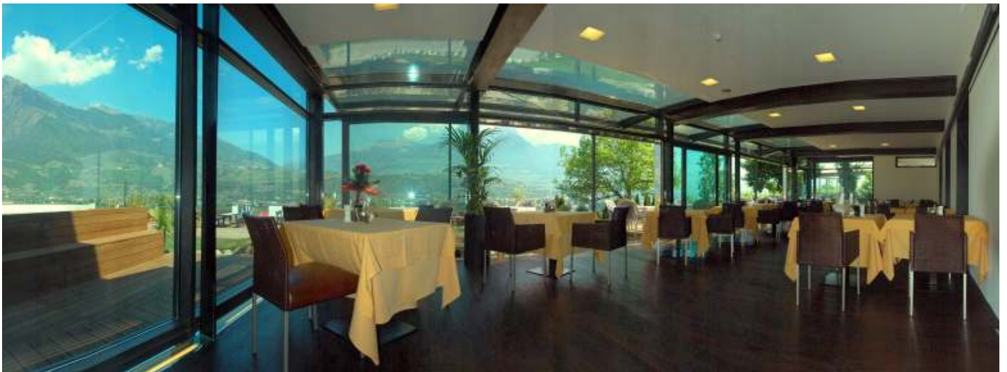
Sonniger Panorama-Wintergarten mit fantastischem Blick über die Terasse nach Meran und Dorf Tirol