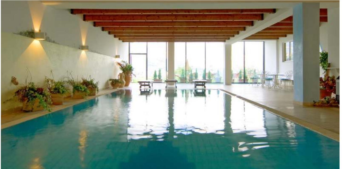
Hallenbad (5x10m, 29°Celsius) mit großer Fensterfront und Blick nach Meran, Besonderheit: Wasser ist salzangereichert und sehr chlorarm

Reinheit durch Salz. Im chlorarmen Hallenbad (29°) und Freibad die wärmenden Sonnenstrahlen des Morgens spüren und Pläne zum Wandern im Meranerland schmieden.