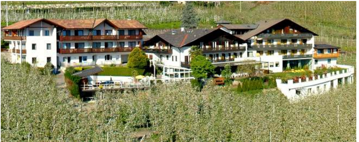
Großansicht vom Erbhof Unterpazeider: links die Residence **** ; ab Mitte bis nach rechts das Hotel *** S