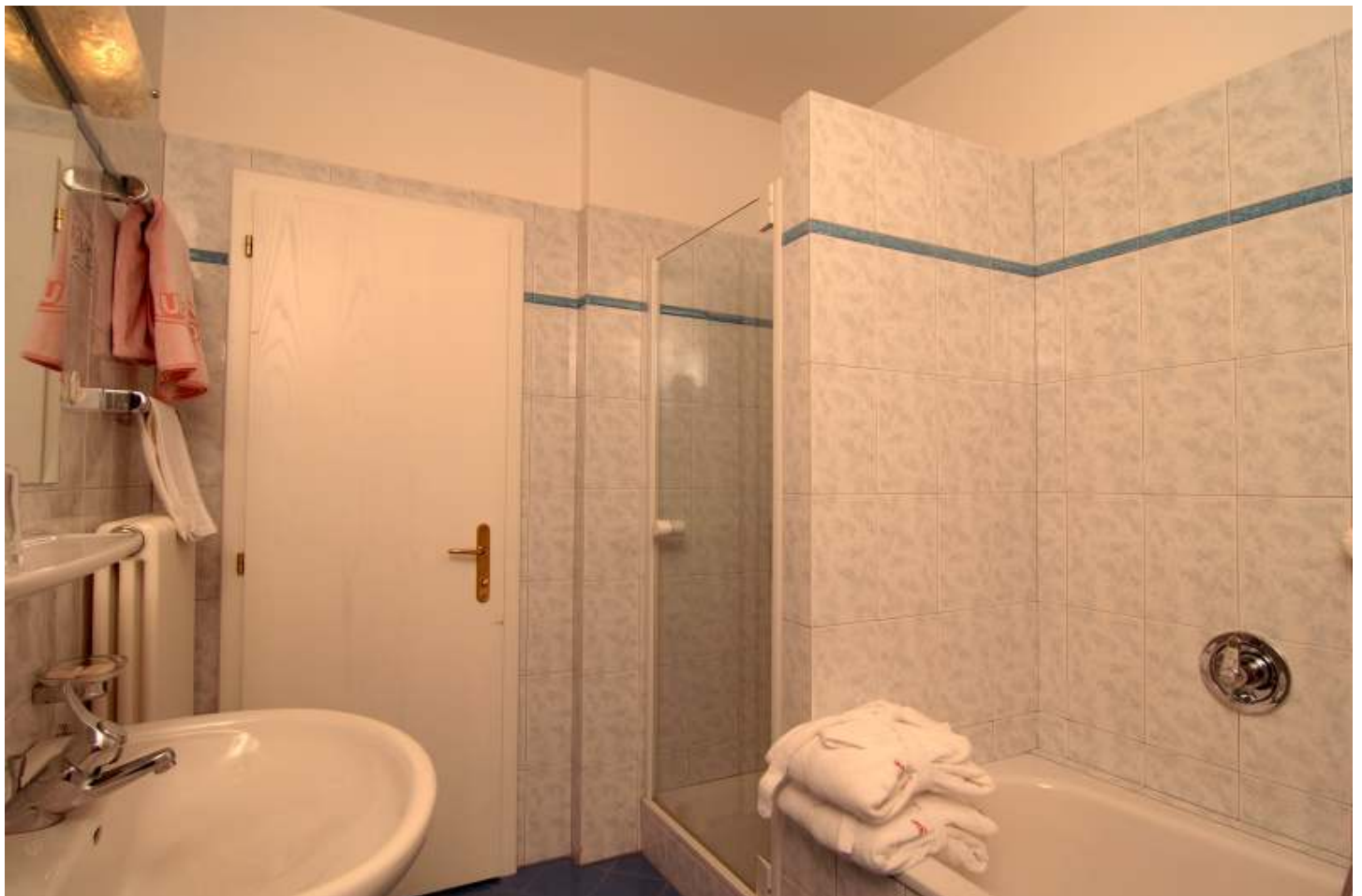
Residence * * * * Bad von Suite mit Du und Badewanne, Bidet und eigenem Fenster