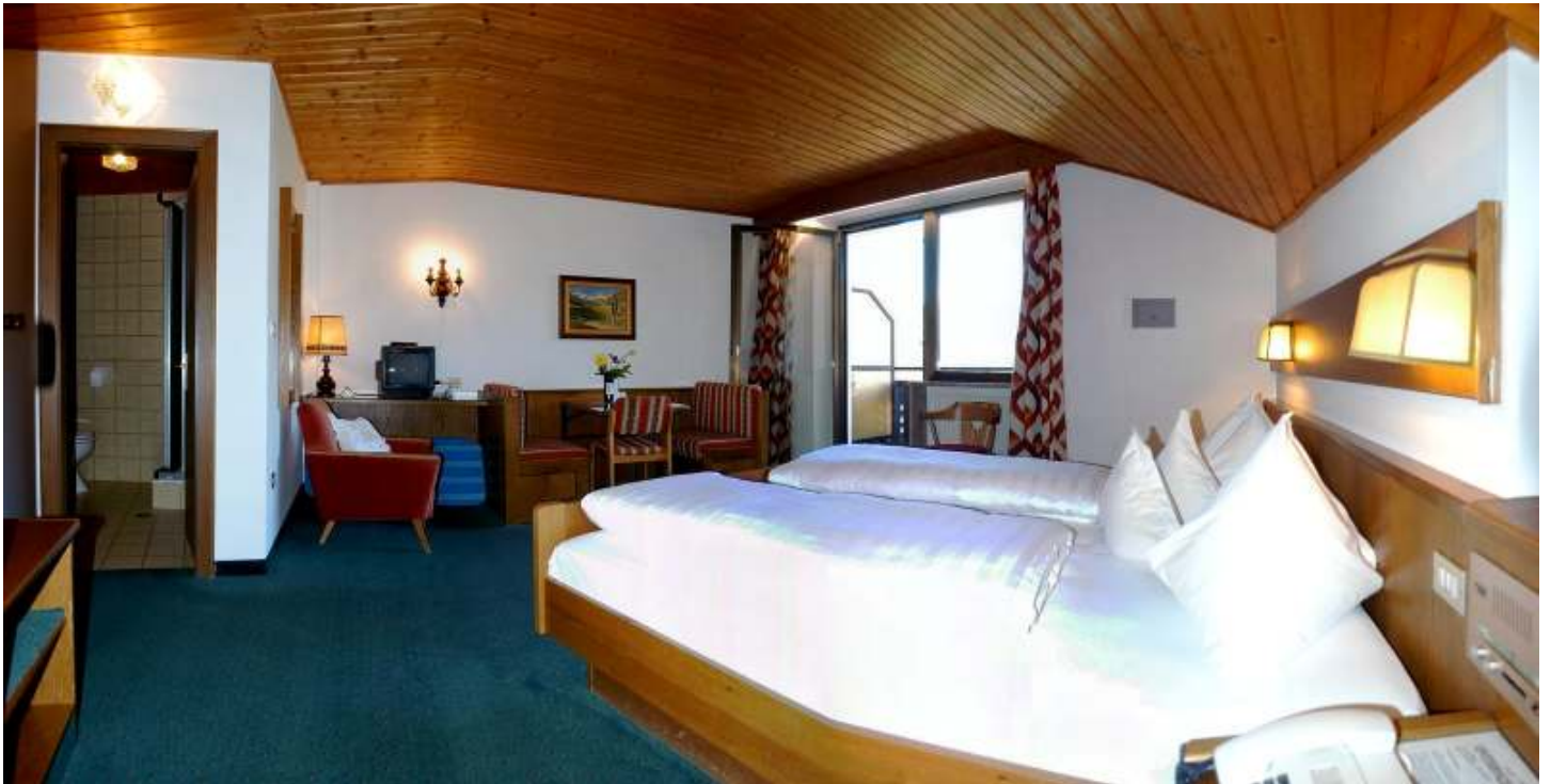
Hotel * * * S Standard Doppelzimmer mit Blick nach Meran, 2-3 Personen