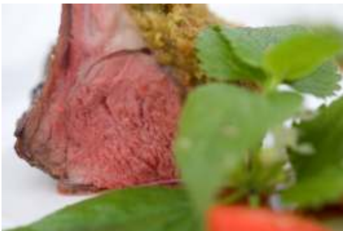
Lammkaree und Lachs auf Spinatteppich