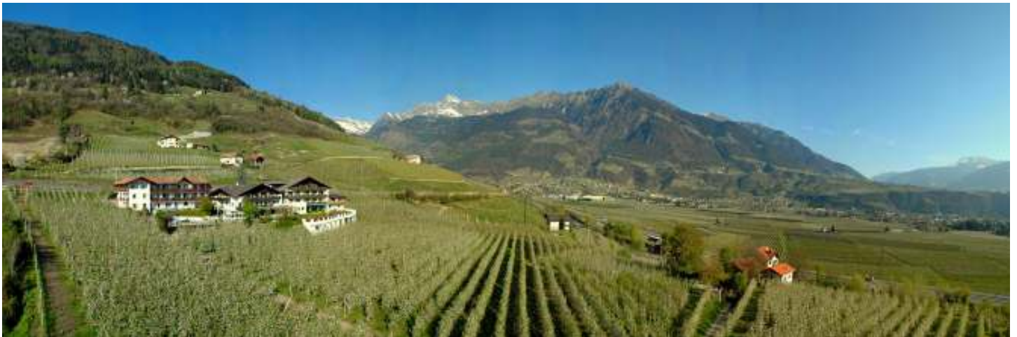
Blick von Marling zum Hotel nach Algund und Meran