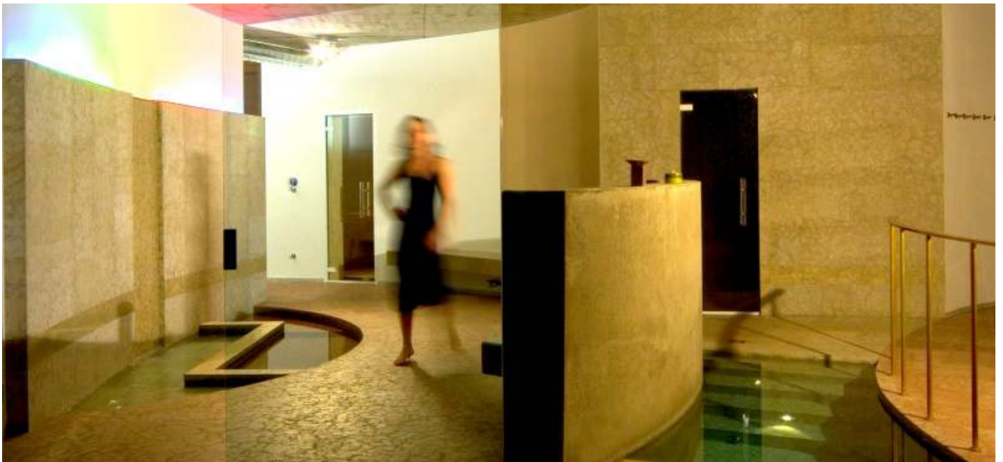
Nacktbereich mit links Kneipp-Kalt-Warm-Wechselbad, Infrarotsauna und rechts türkisches Dampfbad mit Lichtspiel