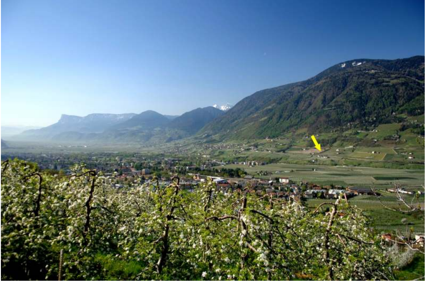
Blick in das Meraner Etschtal von Dorf Tirol nach Marling zum Hotel hin: gelber Pfeil

Das Meraner Etschtal. Zu Füßen des Marlinger Berges liegt die Kurstadt Meran. Darüber eingebettet in Obstwiesen ruht seit Generationen der Erbhof Unterpazeider mit seinem fantastischen Ausblick nach Schloß Dorf Tirol, Algund und Meran