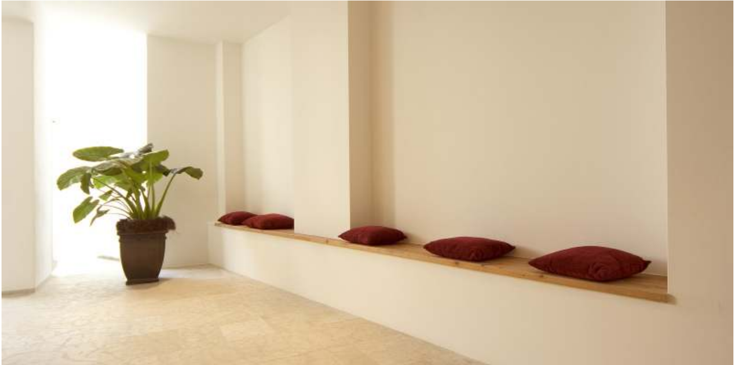
Wellness-Tempel Eingang mit viel Licht

Ein unvergessliches Erlebnis. Individuelles Design nach Feng Shui. 4 Saunas mit Weitblick, Kneippbecken, Tauchbecken mit Quellwasser, Wasserbetten, Beauty, Massagen, Ayurveda und Heubäder.