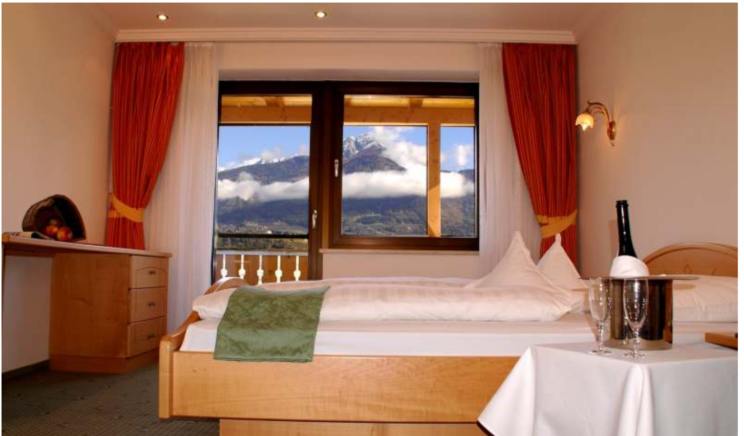
Hotel * * * S Familienzimmer B mit Blick nach Meran, 2-4 Personen