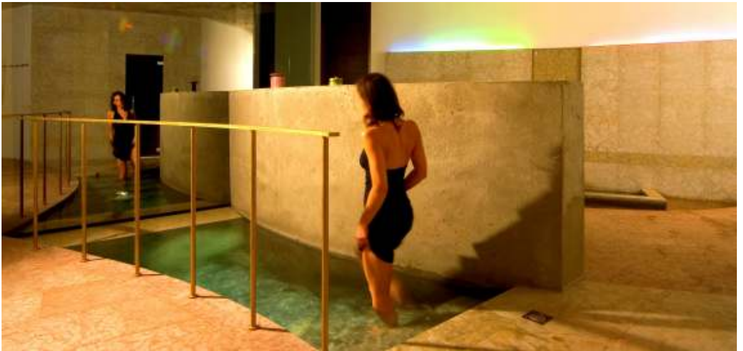
Wellness-Tempel Tauchbecken mit durchlaufendem frischem Quellwasser