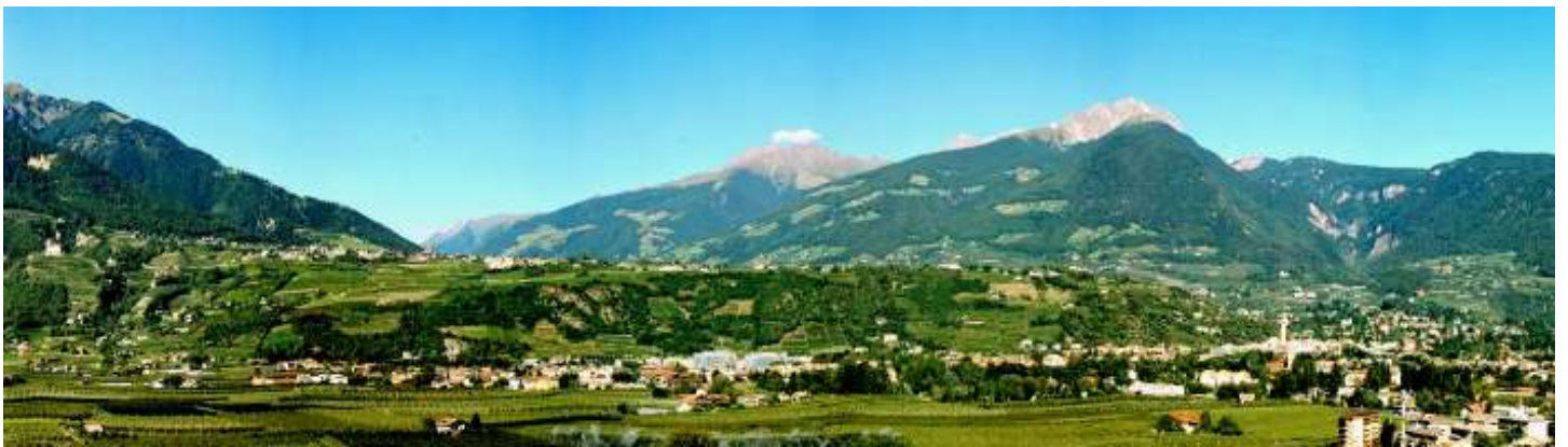
Blick vom Hotel aus ins Meraner Etschtal und nach Dorf Tirol sowie Meran 2000