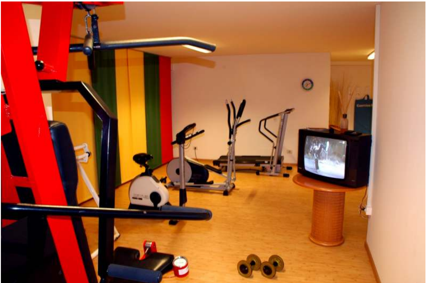
Fitness Raum mit TV und direktem Zugang zum Hallenbad und Garten