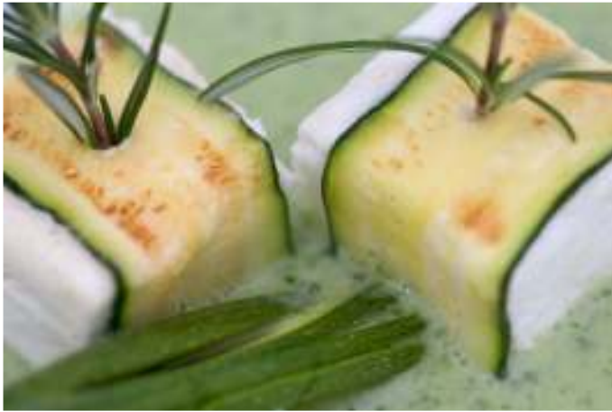
Zucchini auf Käse, Pastet aus Thunfisch mit Dill-Haube

Abwechslungsreich und Kreativ. Südtiroler Spezialitäten und internationale Köstlichkeiten vereint mit viel Gefühl für Wein. Im Sommer Grillabende im Garten.